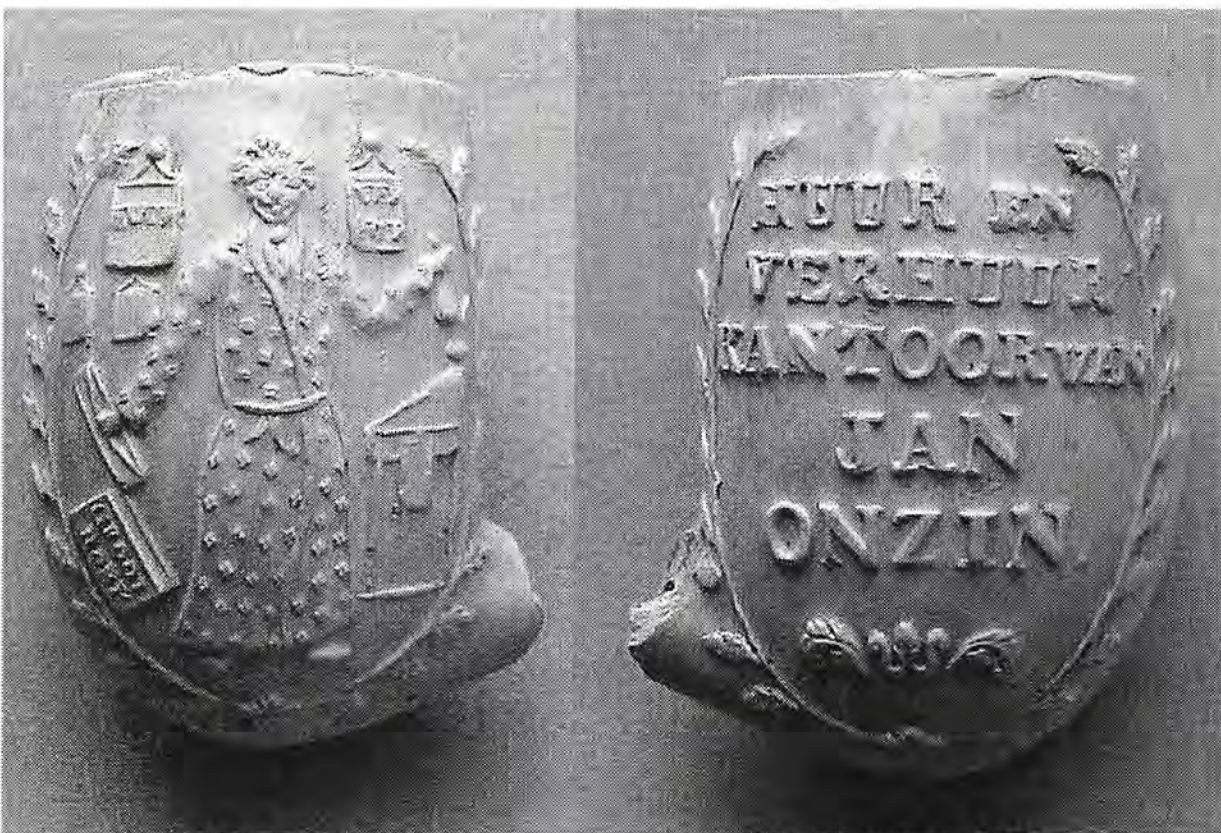
Afb. 1. Mosterdlepel, ongemerkt. Gouda, 1861-c.1870. (Coll. Aad Kleijweg)

Vanaf 1860 zien we een nieuw soort afbeelding op rookpijpen die veelal is gebaseerd op gebeurtenissen van lokaal of nationaal niveau. Sommige van deze voorvallen hebben de geschiedenisboeken niet gehaald en zijn uit ons geheugen gewist. De hieronder afgebeelde opmerkelijke pijp, die regelmatig als bodemvondst wordt aangetroffen, is naar aanleiding van een dergelijk voorval gemaakt. De pijp verwijst naar de Amsterdammer A.J. Onstee, directeur van een huur- en verhuurkantoor en veroorzaker van een oproer dat tot veel zaken aanleiding gaf, waaronder de productie van de Onzin pijpen en als laatste, bijna 150 jaar later, dit artikel.