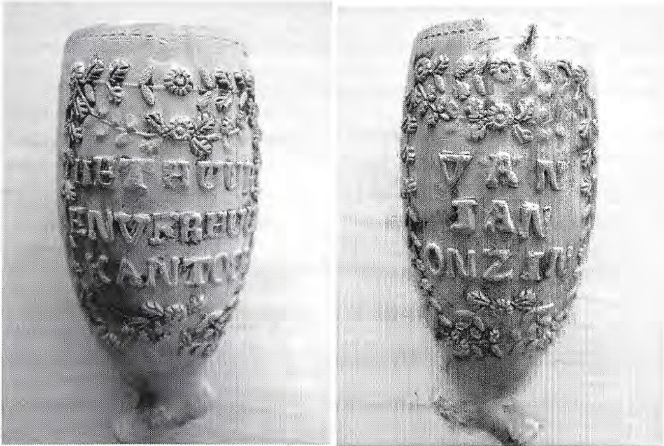
Afb. 3. Ovaal model. Hielmerk GN gekroond. Gouda., Frans Simon Sparnaaij 1861-c.1870. (Coll. Freek Mayenburg)

huur- en verhuurkantoor voor dienstpersoneel en dienstboden op dat tot doel heeft de "zedelijke verbetering van den dienstbaren stand". 2 In zijn